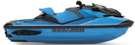
NUEVO Gulfstream Blue Premium